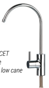
RUBINETTO - FAUCET Miscelatore a 1 vie One-way mixer tap low cane