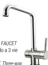
RUBINETTO - FAUCET Monocomando a 3 vie canna alta Single-control, Three-way mixer tap - high cane