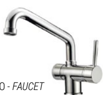
RUBINETTO - FAUCET Monocomando a 3 vie canna bassa Single-control, Three-way mixer tap - low cane