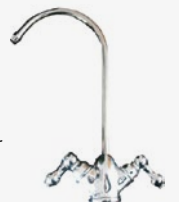
RUBINETTO - FAUCET a colonna, 2 leve e canna Column faucet double lever handles and cane