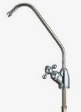
RUBINETTO - FAUCET long-reach