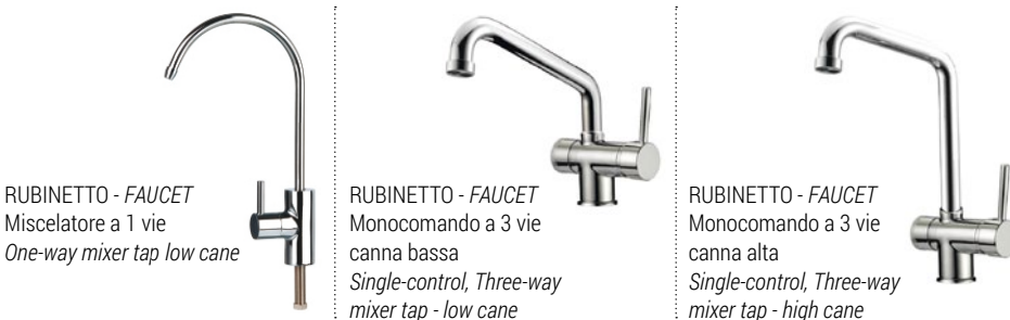
RUBINETTO - FAUCET Miscelatore a 1 vie One-way mixer tap - low cane