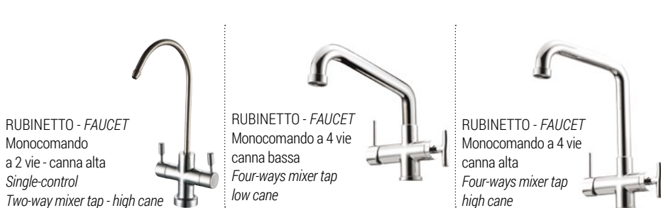
RUBINETTO - FAUCET Monocomando a 2 vie - canna alta Single-control Two-way mixer tap - high cane