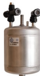
Carbonatore OD ODL carbonator

Capacità carbonatore INTEGRATO NELL'IMPIANTO 0.5 l Carbonation Capacity INTEGRATED IN THE SYSTEM