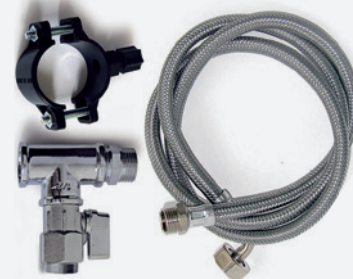
Kit di installazione Installation Kit

La Commercè ha scelto la qualità dei raccordi ad innesto rapido di