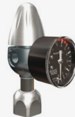
Riduttore per bombole ricaricabili con manometro di bassa pressione assiale Reducer for rechargeable gas cylinders with axial low pressure gauge