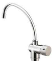
RUBINETTO - FAUCET 3 acque 3 water