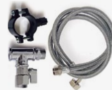
Kit di installazione Installation Kit