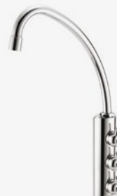
RUBINETTO - FAUCET

La Commercè ha scelto la qualità dei raccordi ad innesto rapido di La Commercè has chosen the quality of John Guest push-in fittings