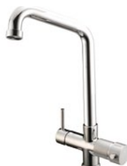
RUBINETTO - FAUCET Monocomando - a 5 vie - canna alta Single-control - Five-way mixer tap - high cane