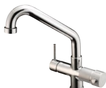
RUBINETTO - FAUCET Monocomando - a 5 vie - canna bassa Single-control - Five-way mixer tap - low cane