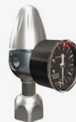
Riduttore per bombole ricaricabili con manometro di bassa pressione assiale Reducer for rechargeable gas cylinders with axial low pressure gauge