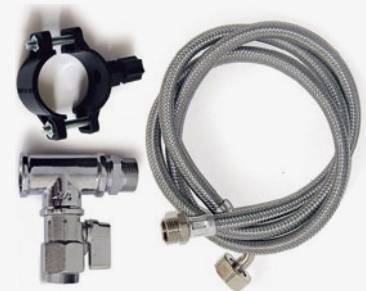
Kit di installazione Installation Kit

La Commercè ha scelto la qualità dei raccordi ad innesto rapido di La Commercè has chosen the quality of John Guest push-in fittings