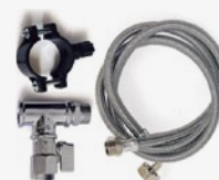
Kit di installazione Installation Kit