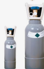
Bombola CO 2 ricaricabile 4 o 10 Kg CO 2 cartridge rechargeable 4 or 10 kg