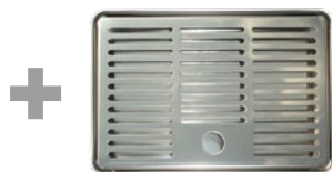
Cod 350.001 cm15x22 inox