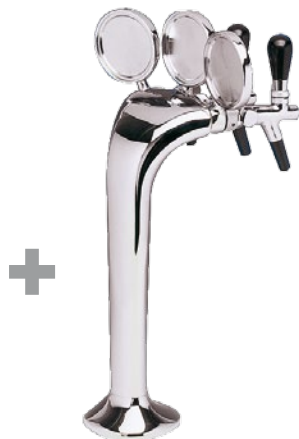
Cod 503 colonna ottone 3 uscite brass colum with 3 ways